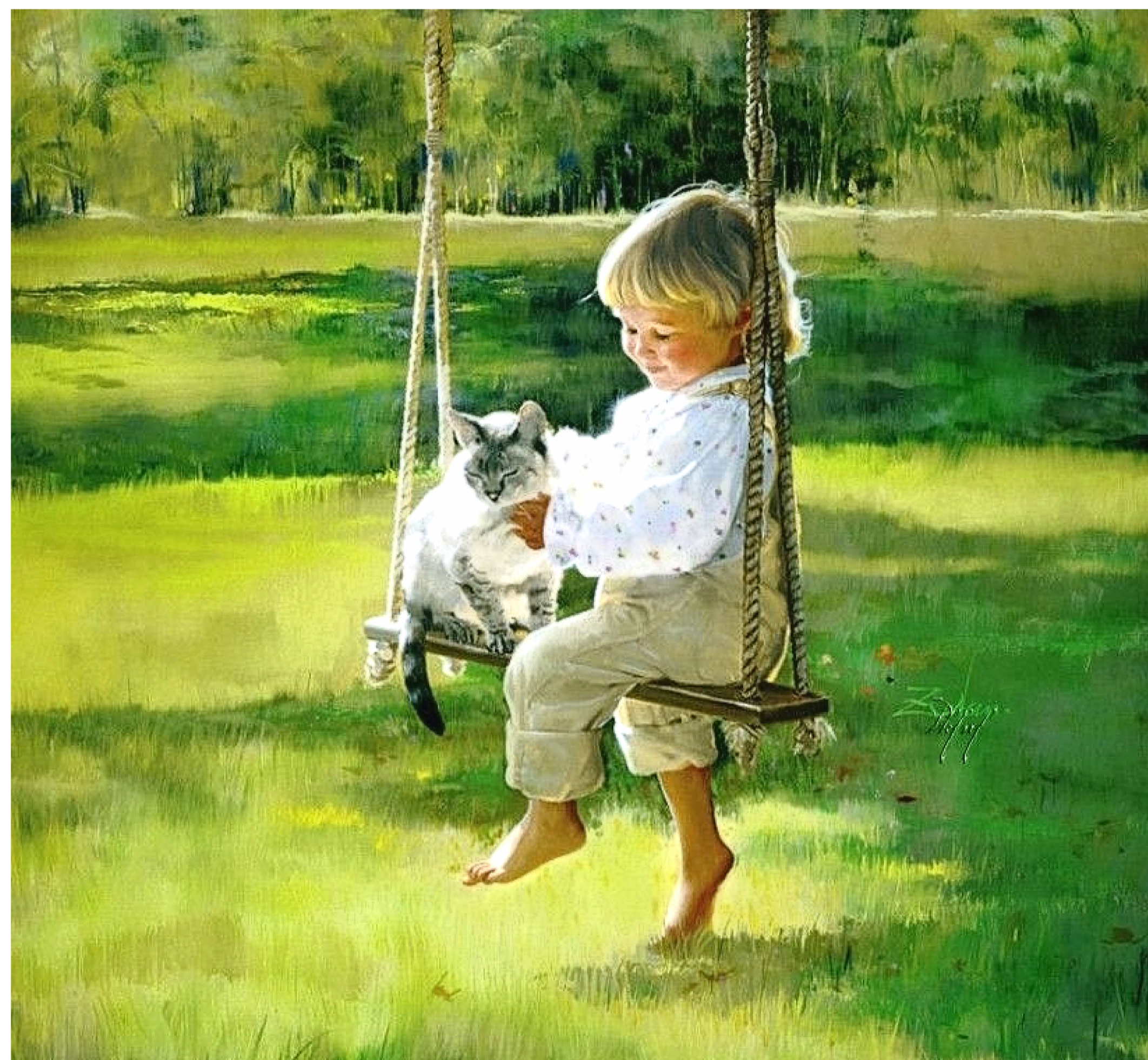
Художник Дональд Золан | Картина "Детская влюбленность"

Каков он, внутренний мир ребёнка: сказочный, волшебный, открытый, искренний, восприимчивый, очень хрупкий и ранимый? И, если, с одной стороны, самим естественным в наших детях запущен неуёмный процесс познания и стремления развиваться через изучение того мира, который попадает в поле вос-