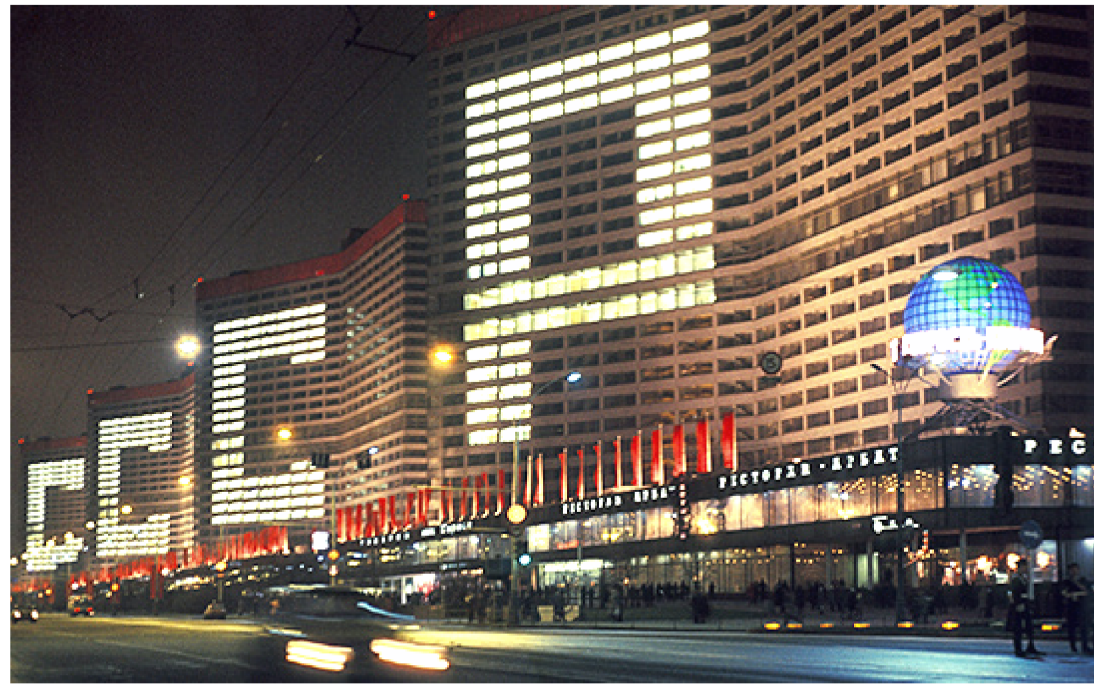
Советский Союз входил в пятерку государств мира, которые могли самостоятельно производить все существующие виды промышленной продукции.

Отдельным пунктом регулируется порядок экспорта продовольственных товаров и сельскохозяйственной продукции. Вывоз зерновых культур (пшеница, рожь, ячмень, овёс, кукуруза), масла семян и растительных масел, мясомолочной продукции, рыбы и морепродуктов, а также других видов продовольствия допускается исключительно в следующих случаях: