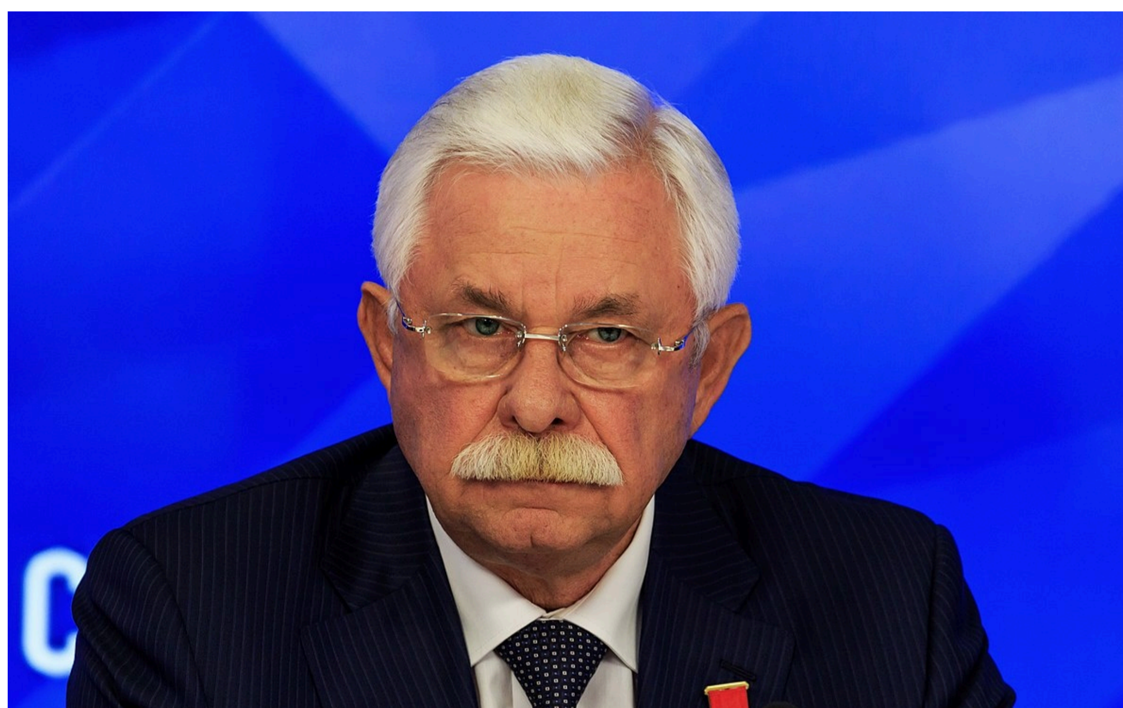
Александр Владимирович Руцкой — государственный и политический деятель, Герой Советского Союза, генерал-майор авиации.

В 1959 году СССР спустил на воду «Ленин» — первый в мире атомный ледокол, открывший новую эру в освоении Арктики.