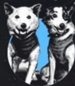
4. БЕЛКА И СТРЕЛКА