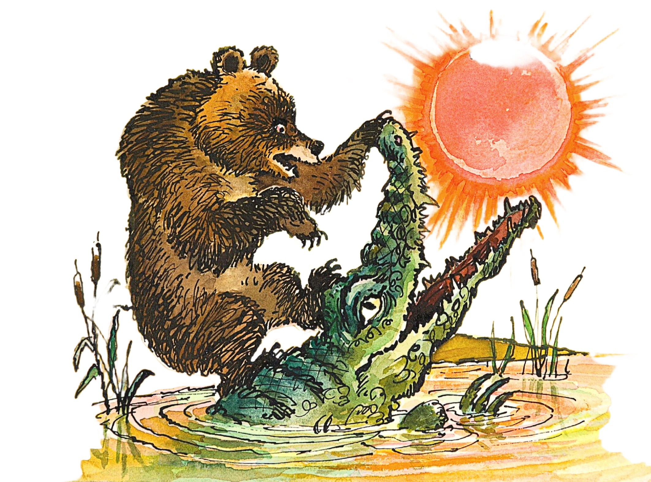
...Уж он мял его и ломал его: «Подавай сюда наше Солнышко!» Корней Чуковский "Краденое Солнце"

Самый чудовищный обман, фундамент всех последующих, – это подмена нашего истинного статуса. Обманом нам подсунули ущербную роль недееспособного физического лица, винтика на балансе какой-то абстрактной "компании". Нас лишили гордого звания Суверенного гражданина СССР – статуса, дарованного историей, кровью предков и высшим, Божественным правом. Этот статус – не бумажка, его нельзя аннулировать указами сомнительных контор. Его можно лишь добровольно сдать, поддавшись на сладкие посулы и изощренную ложь.